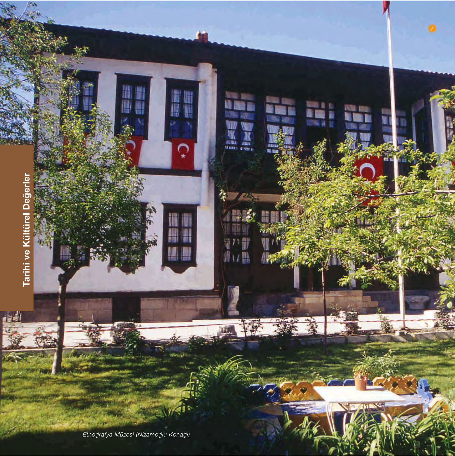
Etnoğrafya Müzesi (Nizamoğlu Konağı)