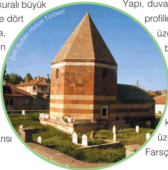
Şah Sultan Hatun Türbesi

Çandır ilçesinde 1500 yılında yapılan türbe, Dulkadirli Beyi Alaudevle'nin oğlu Şahruh'un karısı Şahsultan'a aittir.