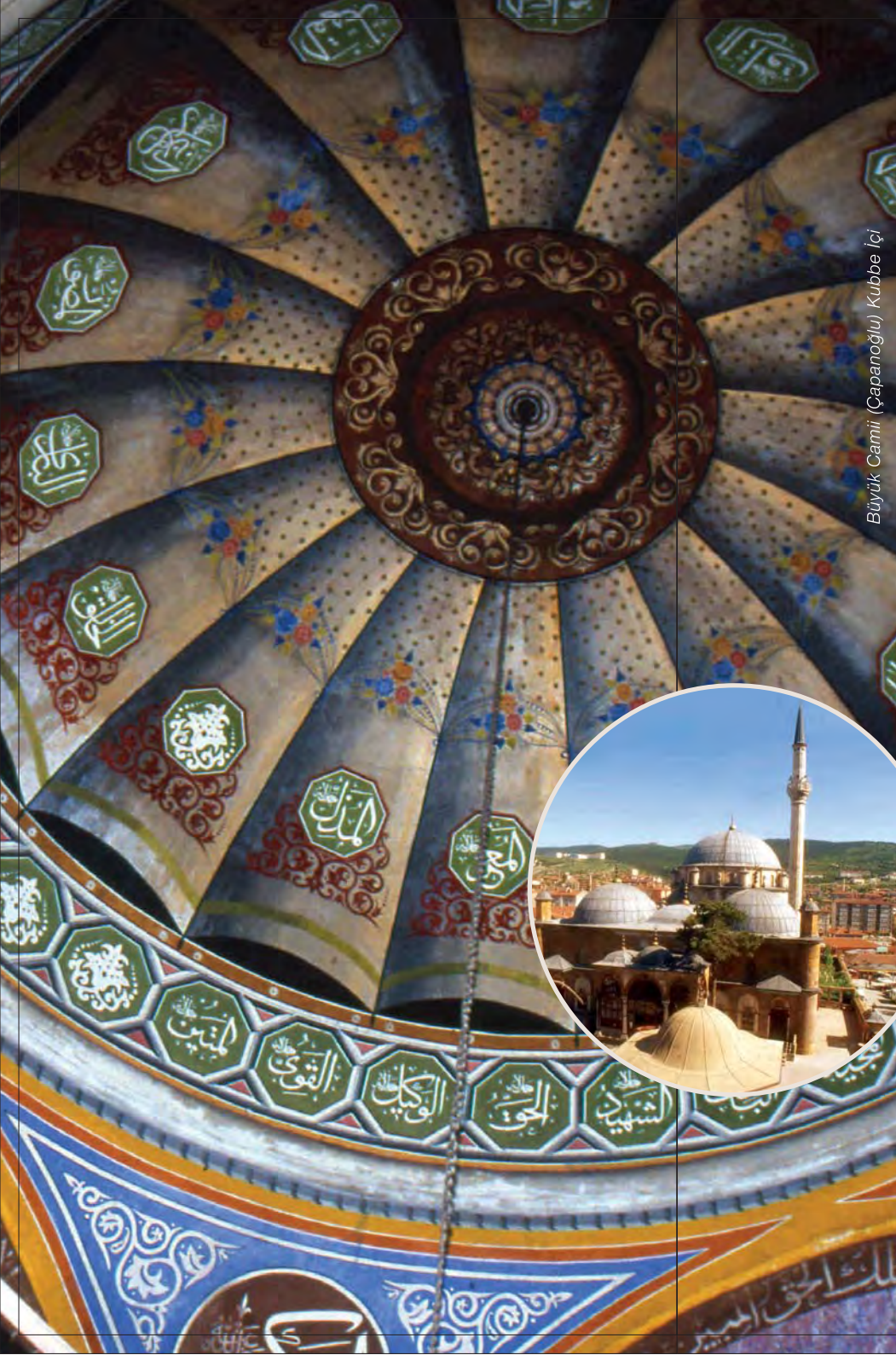
Büyük Camii (Çapanoğlu) Kubbe İçi

Camide canlı renkler kullanılarak yapılan motifler kubbelerin sanatsal ve görsel estetiğini destekler niteliktedir.